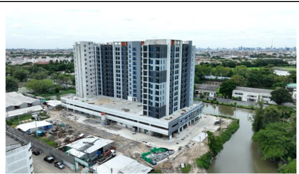
เดือนกันยายน 2566