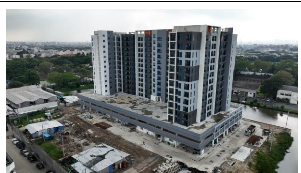
เดือนตุลาคม 2566