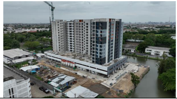
เดือนกรกฎาคม 2566