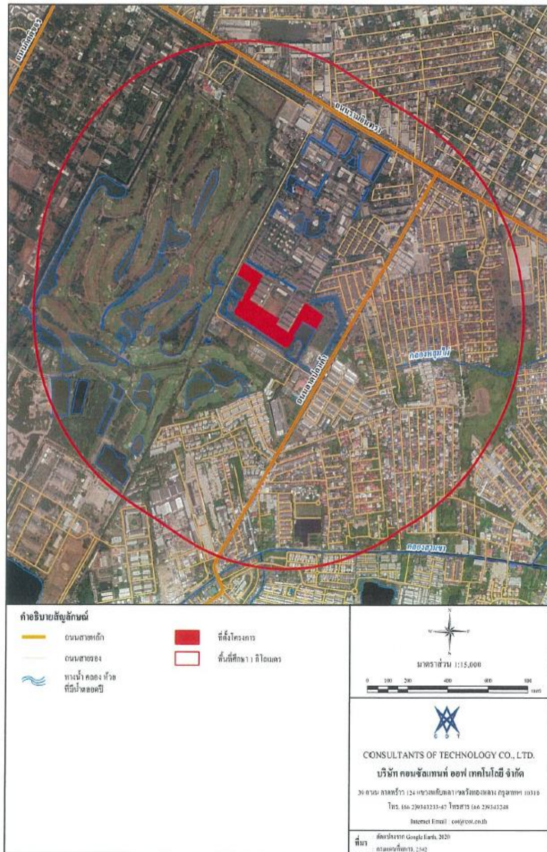
รูปที่ 1.2-1 ที่ตั้งโครงการ